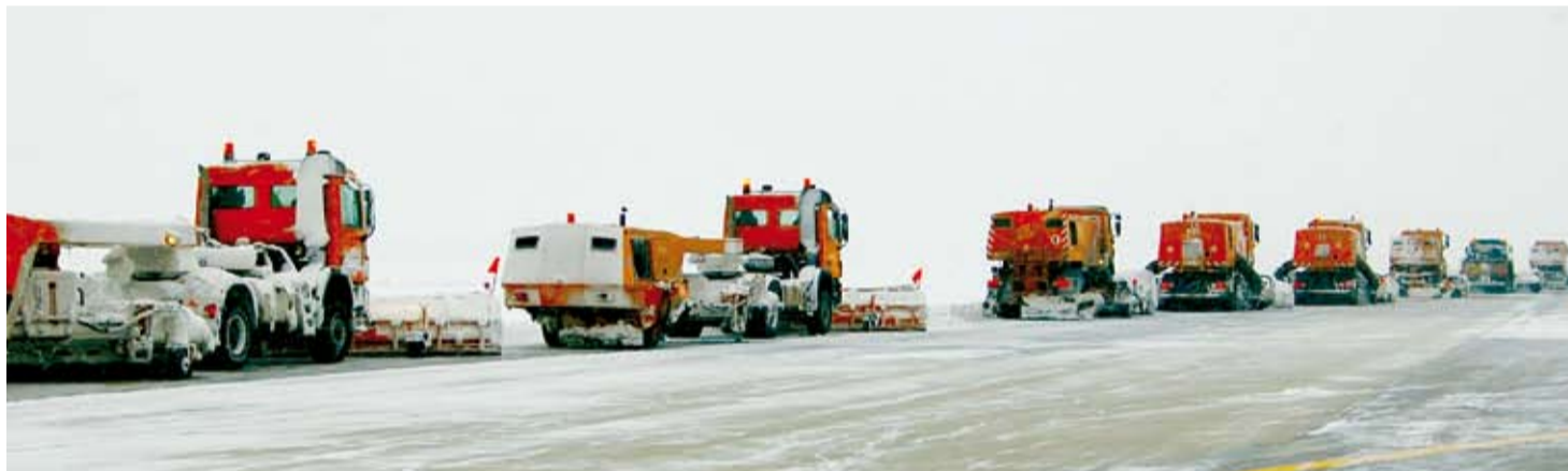
Zametače pražského letiště umí najednou očistit plochu o šířce až 55 metrů

Díky technice i profesionálnímu nasazení všech zúčastněných zůstal provoz na Letišti Praha i během nejhustšího sněžení bez omezení. Žádné letadlo nebylo odkloněno a kvůli odklizení sněhu nebyl zrušen jediný let.