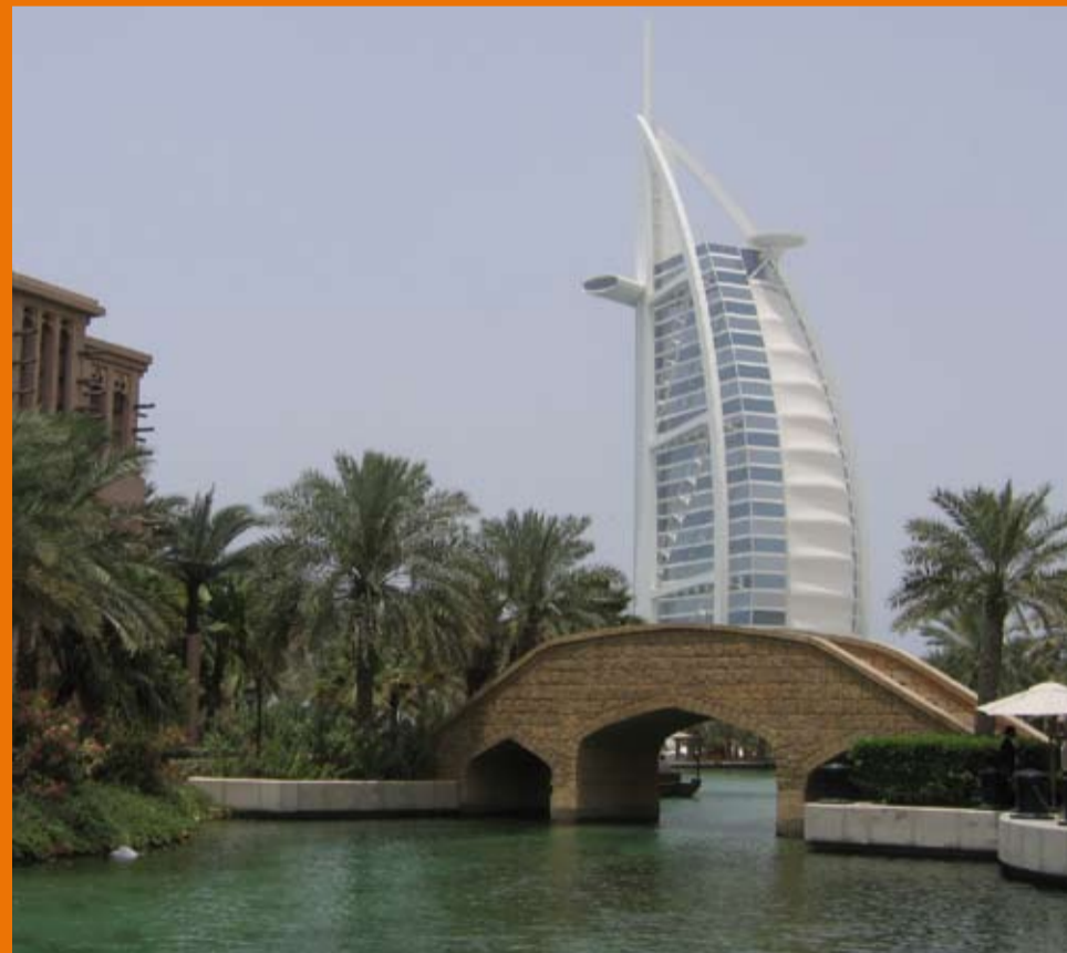
Ilustrační foto: Sedmihvězdičkový hotel Burj Al Arab u pláže Jumeirah v Dubaji

Více informací o Dubaji a řadě dalších nových destinací najdete od dubna 2010 na www.letejteprahy.cz .