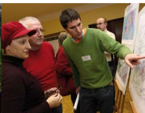
Obyvatelé Lysolaj se ptali zejména na noční provoz