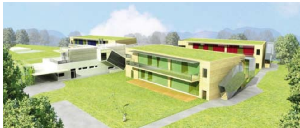
Vizualizace nových pavilonů mateřské školky v Horoměřicích

Zajímavý program pro seniory Penzion pro seniory Horizont získal peníze na zajištění programu pro seniory. Klienti denního stacionáře se budou moci zúčastnit kulturně-spoločenských akcí, které jsou zaměřené na udržování mentální, psychické a fyzické kondice, zachování a zlepšování soběstačnosti a celkového „zpomalování stárnutí“.