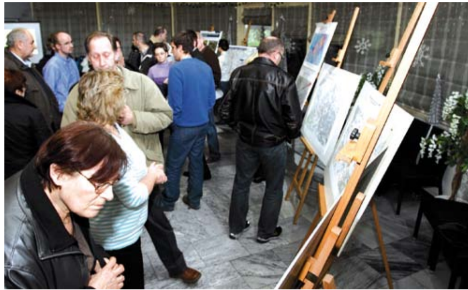
Obyvatelé dotčených oblastí živě diskutovali o dalším rozvoji letiště v Ruzyni

Zástupci Letiště Praha v únoru opět vyrazili mezi obyvatele obcí a městských částí ve svém nejbližším okolí. Svým sousedům odpovídali na dotazy týkající se dalšího rozvoje letiště Praha/Ruzyně a především stavby nové přistávací dráhy.