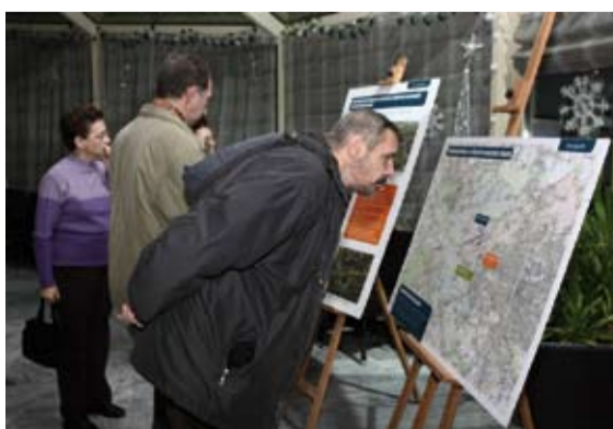
Informační panely poskytly řadu informací o paralelní dráze

Informační kampaň proběhla v celkem 11 místech v sousedství letiště. Návštěvníci si mohli prohlédnout film o nové dráze a několik informačních panelů. O projektu a problematice životního prostředí a hluku si všichni zájemci mohou najít informace na webových stránkách www.paralelnidraha.cz .