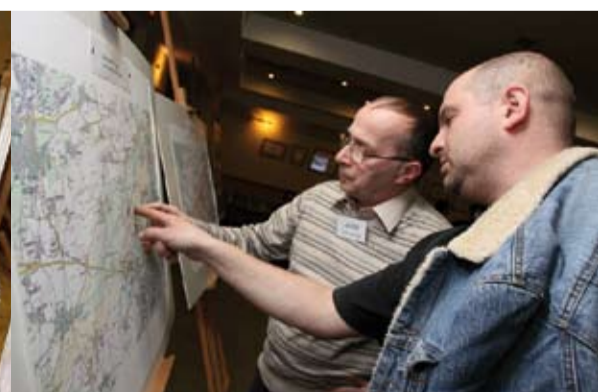
V Nebučichách se zajímali o vliv dráhy na cenu nemovitostí