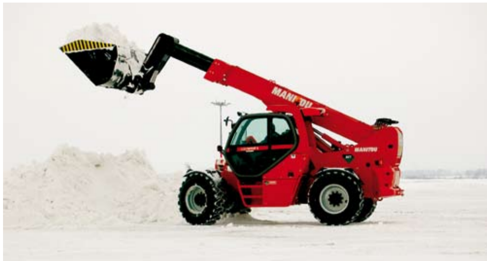
S úklidem sněhu pomohl i multifunkční stroj Manitou s obří lžící

Zrušené lety, zpoždění, tisíce pasažerů čekajících na odlet. Tento obrázek byl počátkem ledna k vidění na mnohých evropských letištích. Nečekané sněžení zasáhlo Berlín, Frankfurt, Lyon i londýnské Heathrow. Letiště Praha však sněhovou kalamitu zvládlo bez větších komplikací a díky výkonným strojům a vysokému nasazení personálu nemuselo zrušit jediný spoj.