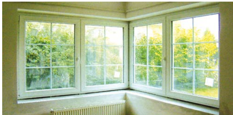
Ukázka nových oken v ochranném hlukovém pásmu Letiště Praha

nových a veškeré zednické či obkladačské práce. Po výměně zajistíme také závěrečný úklid,“ dodává Říhová. Pokud dojde k rozšíření ochranného hlukového pásma, Letiště Praha počítá s tím, že protihluková okna a balkonové dveře nainstaluje i ve všech nově zahrnutých oblastech, a to ve dvou etapách. První bude hotova do zprovoznění paralelní dráhy (území s možností zatížení nadlimitním hlukem), druhá do 3 let od uvedení paralelní dráhy do provozu (zbývající území v rozsahu navrhovaného OHP). Do roku 2017 na ně plánuje vynaložit přes miliardu korun.