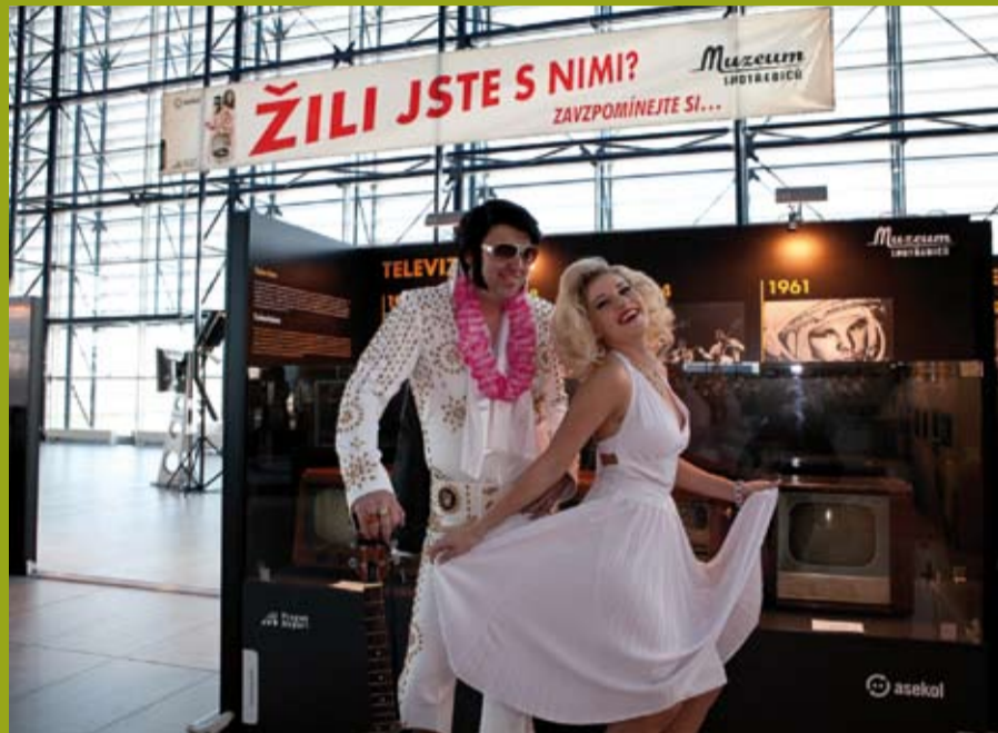
Otevření Muzea elektrospotřebičů na Letišti Praha

Návštěvníci si také mohou některé spotřebiče sami vyzkoušet, podívat se na historické televizní a rozhlasové záznamy či si zahrát jedny z prvních počítačových her. Cílem projektu je mimo jiné veřejnosti připomenout, proč je důležité třídít vysloužilá elektrozařízení. I samotné muzejní exponáty pocházejí většinou ze sběrných dvorů, kam je jejich předchozí majitelé odložili. Tuto sbírku pak doplnily historické elektrospotřebiče z Technického muzea v Brně.