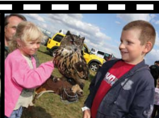
Děti si prohlédly sovy a sokoly