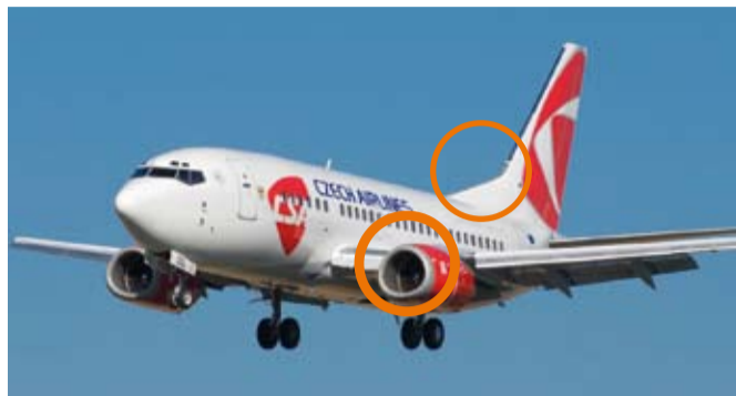
Boeing - trojúhelníkový tvar motorů a zalomená hrana kormidla

Nejčastějším typem letadla, s nímž se lze na Letišti Praha setkat, je Boeing B737. Jen v loňském roce jej letecké společnosti nasadily na více než třetinu letů z pražské Ruzyně a na ni. Velký konkurent Boeingu 737 - Airbus A320 - se na obloze nad Ruzyní objevil na necelé čtvrtině všech letů.