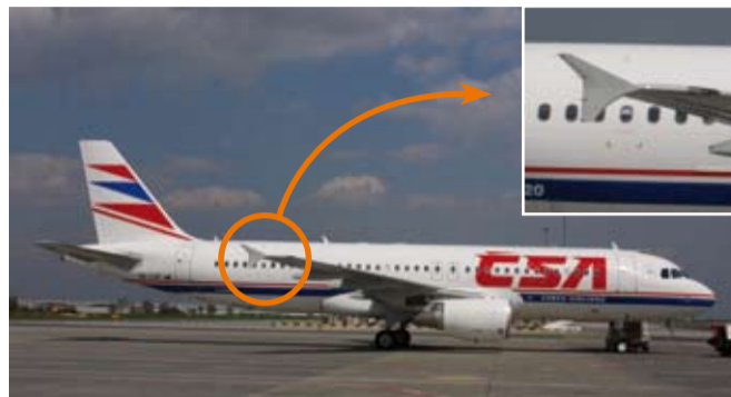
Airbus - trojúhelníkové zakončení křídel