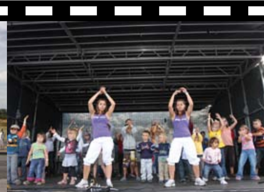
...a soutěžily v tanci