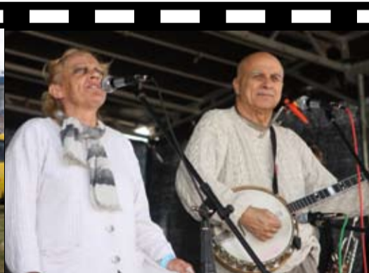
Návštěvníkům zazpíval Band Ivana Mládka