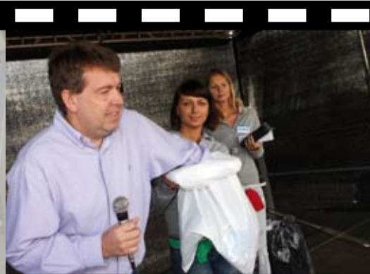
Losování na hlavním podiu