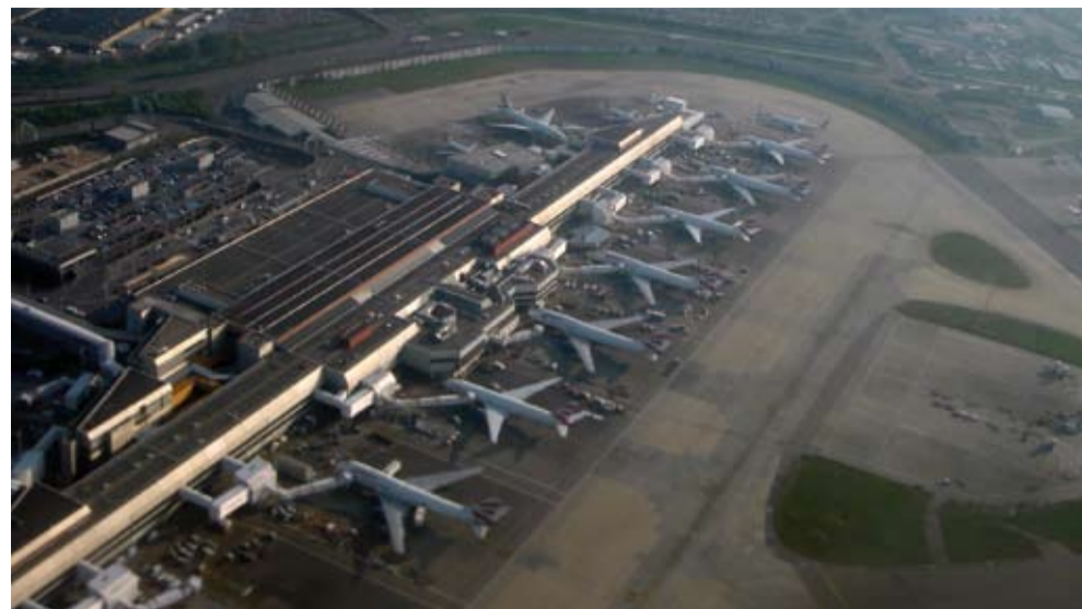
Ilustrační foto: letiště Heathrow

Největší londýnské letiště Heathrow připravuje výstavbu třetí přistávací dráhy. Její provoz by měl významně podpořit britskou ekonomiku. V příštích desetiletích by podle odhadů ekonomické studie měl přinést 30 miliard liber (téměř 900 miliard korun).