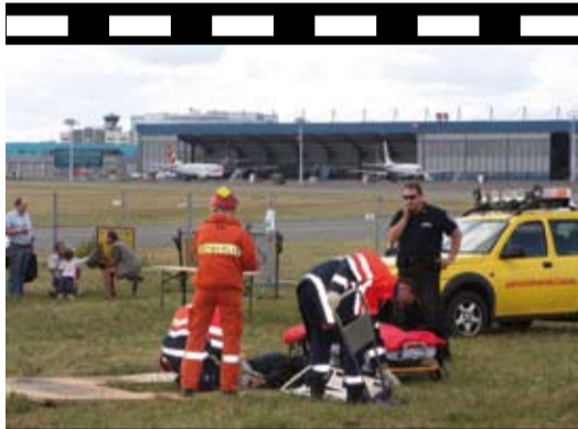
Hasiči předvedli zásah

Na konci srpna se přímo v areálu ruzyňského letiště sešly stovky obyvatel z nejbližšího okolí, pro něž Letiště Praha připravilo informačně-zábavné odpoledne. Malí i velcí návštěvníci měli možnost prohlédnout si letištní techniku, moderní hasičská auta, policejní techniku či vrtulník. Své síly změřili také v různých soutěžních disciplínách. A kromě toho se mohli seznámit s plány na další rozvoj letiště.