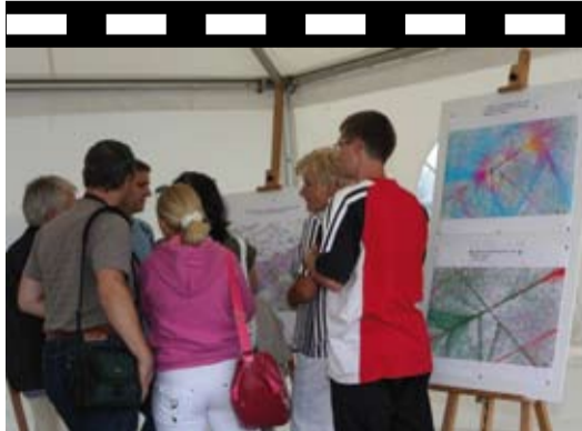
V infostanu bylo rušno