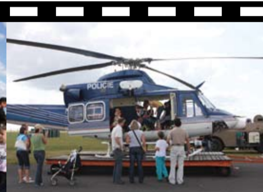
Policejní helikoptera lákala k prozkoumání