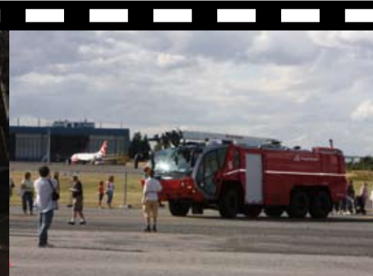
Děti se mohly svést hasičským autem