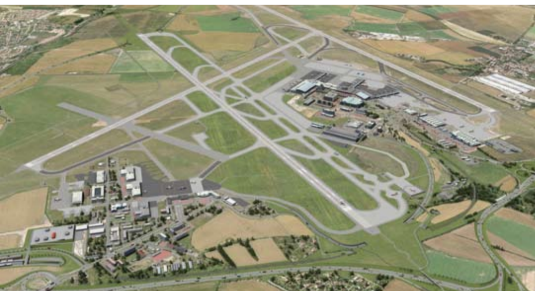
Ilustrační foto: vizualizace paralelní dráhy