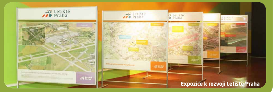
Expozice k rozvoji Letiště Praha

V případě velkého zájmu ze strany veřejnosti bude Letiště Praha informační odpoledne pravidelně opakovat. Více informací na www.prg.aero .