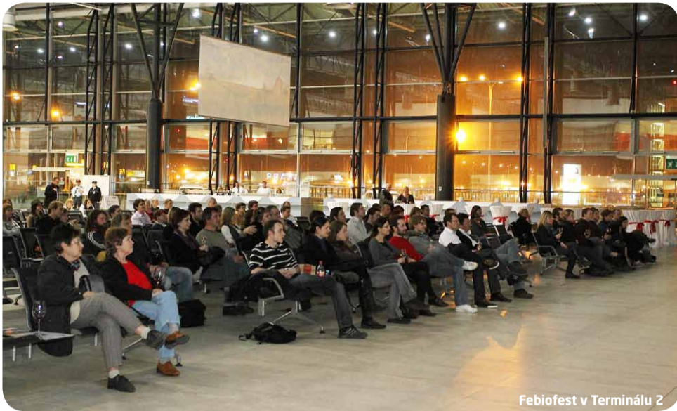
Febiofest v Terminálu 2

Na konci letošního března Letiště Praha nabídlo svým návštěvníkům i cestujícím netradiční zážitek. V rámci Mezinárodního filmového festivalu FEBIOFEST mohli zdarma zhlédnout několik filmových