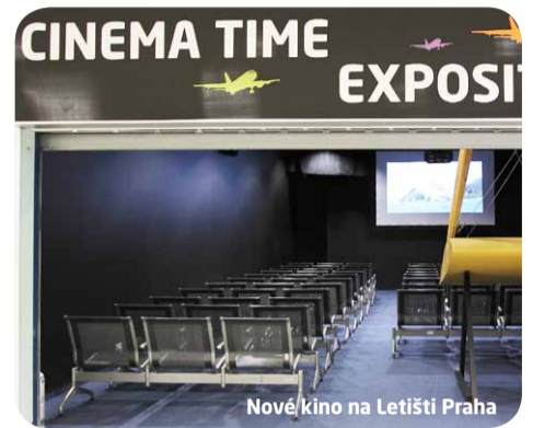
Nové kino na Letišti Praha