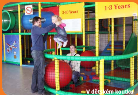
V dětském koutku

Čekání na odlet letadla si mohou příjemně zkrátit i malí netrpělivci. V tranzitních prostorách Letiště Praha jsou pro děti připraveny dva dětské koutky. Jeden rodiče naleznou v Terminálu 2 vlevo za bezpečnostní kontrolou, druhý se nachází ve spojovací hale mezi Terminály 1 a 2 v prodejně hraček Bambule. Na děti zde čeká celá řada prolézaček, houpaček, stavebnic a her s leteckou tematikou. Kromě dětských koutků se malí cestovatelé mohou