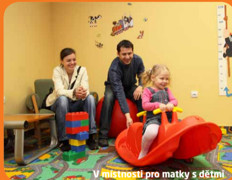
V místnosti pro matky s dětmi

Více informací na www.prg.aero v sekci Služby a volný čas.