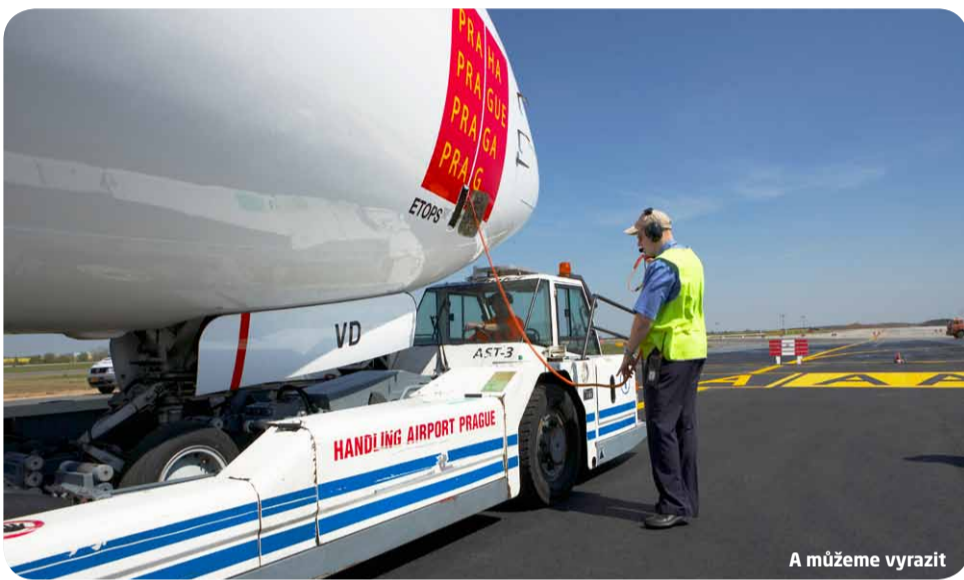
A můžeme vyrazit

Na každý let je na letišti třeba připravit nejen cestujícího tým, že mu personál vystaví palubní lístek, odbaví zavazadlo, zkontroluje doklady a provede bezpečnostní prohlídku, ale jiný personál se ve stejnou dobu musí postarat o letadlo. Letadla na letištích mezi příletem a odletem stráví odlišnou dobu. Ta záleží na typu letadla, povaze letu či na leteckém dopravci. Dopravní letadlo se na letištní ploše zdrží průměrně 50 až 60 minut. Menší stroje nebo nízkonákladové dopravci potřebují o něco méně času. Dálkové lety vyžadují naopak až dvě hodiny. Na všechna letadla po přistání čeká odbavení, které představuje řadu úkonů od manipulace se zavazadly, prohlídku stroje až po úklid kabiny.