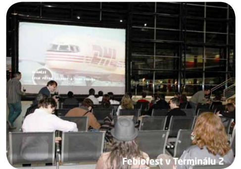
Febiofest v Terminálu 2

Promítat se bude každý den od 10 do 23 hodin, pokud nebude v programu aktuálně určeno jinak. K vidění bude vždy 5 až 7 filmů, které poběží ve smyčce. Kino CINEMA TIME, které má kapacitu 78 míst, je otevřené pro veřejnost zdarma. Nachází se v 1. patře veřejné části spojovacího objektu mezi Terminály 1 a 2 v blízkosti vyhlídkové terasy.