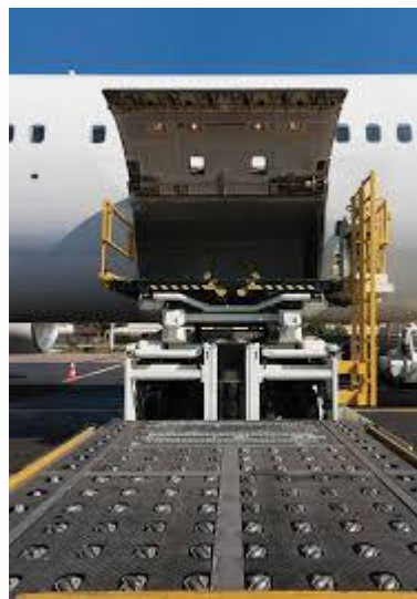
Example: A330 Cargo door

K těmto případům však dochází a způsobily na našem letišti již několik poškození letadel. Na zahraničním letišti při takovém postupu pracovník uklouzl a došlo ke smrtelnému zranění.