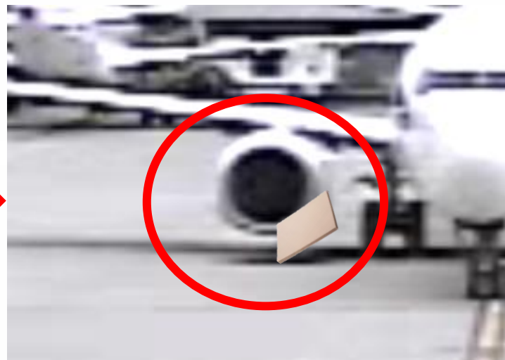
... a jak to končí! ... and how it ends!

There was a situation where a cardboard pad fell off a trolley and wasn't taken away after the aircraft departure out of stand 14. Nor the following hour when it moved across the next occupied stand 15 until it was blown onto the stand 16 just before the aircraft arrived and was sucked in the engine!