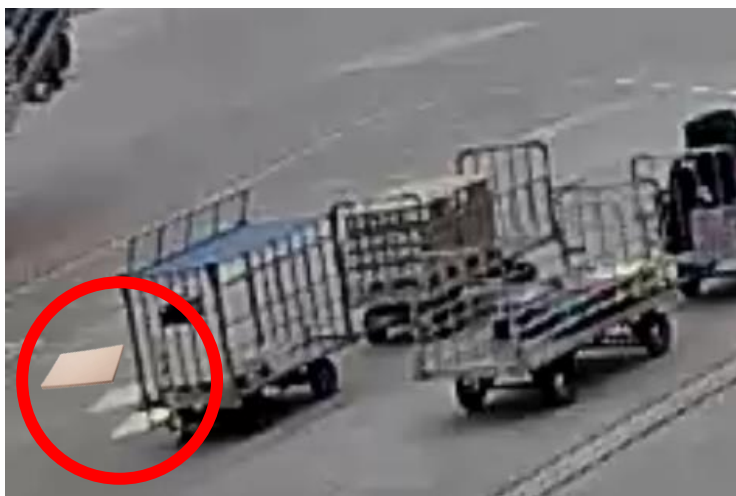
Jak to začíná... How it starts...

Situace kdy kartonová podložka spadne z klecového vozíku, není uklizena po odbavení letadla a ani v následující hodině, kdy se posouvá napříč dalším odbavovaným stáním je následně zafouknuta na stání těsně před příjezdem letadla a nasána do motoru!