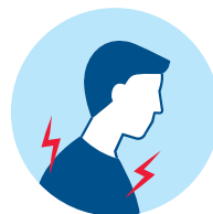
Muscle Pain Bolest svalů Dolore muscolare Muskelschmerzen