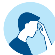
Fatigue Únava Stanchezza Müdigkeit