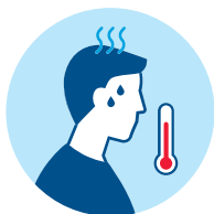
Fever Zvýšená teplota Febbre Fieber