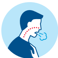
Shortness of Breath Dušnost Fiato corto Atembeschwerden